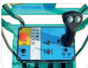
Robuster, einfacher und intuitiver Bedienpult auf der Plattform